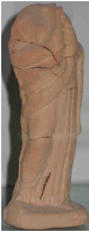
Fig. 3: Statuetta acefala di suonatrice di aulos . Agrigento, Museo Archeologico Regionale, Inv. AG. 7550 (BELLIA 2009, nr. 18)