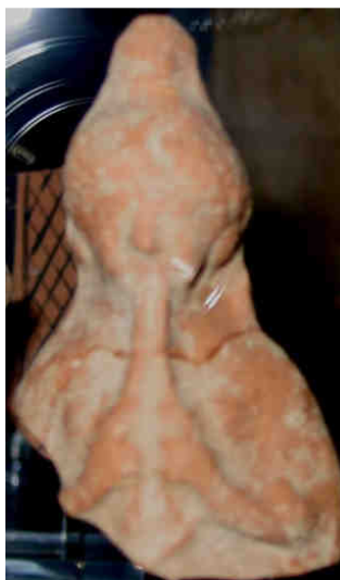
Fig. 5: Frammento di suonatrice di aulos . Siracusa, Museo Archeologico Regionale, Inv. S.B. 431 (Bellia 2009, nr. 346)

Le Tesmoforie in Sicilia sono ricordate dalle testimonianze scritte, che si riferiscono a un ampio periodo compreso dall'età arcaica all'età romana e a vari luoghi dell'isola. Se pur con le varianti locali, le festività si svolgevano nell'arco di tre giorni: il primo, anodos , dedicato alla pompé delle donne che portavano con loro tutto l'equipaggiamento per il sacrificio; il secondo, nesteia , il giorno del digiuno che si concludeva il terzo, i kalligeneia , con un ricco banchetto 20 . Polieno 21 ricorda le feste ad Agrigento e Platone 22 accenna a quelle celebrate sull'acropoli di Siracusa; Plutarco 23 racconta il giuramento del tiranno Callippo nel santuario siracusano delle dee tesmofore 24 . Nella cosiddetta "versione siciliana" del mito Diodoro 25 adopera il termine thesmophoros per indicare Demetra che, per aver donato il grano e introdotto le leggi che regolano la vita civile, era onorata con una festa definita «splendidissima per la magnificenza dell'allestimento» 26 . Non può escludersi che, data la fastosità e l'ampio coinvolgimento popolare, le festività fossero arricchite dalla musica.