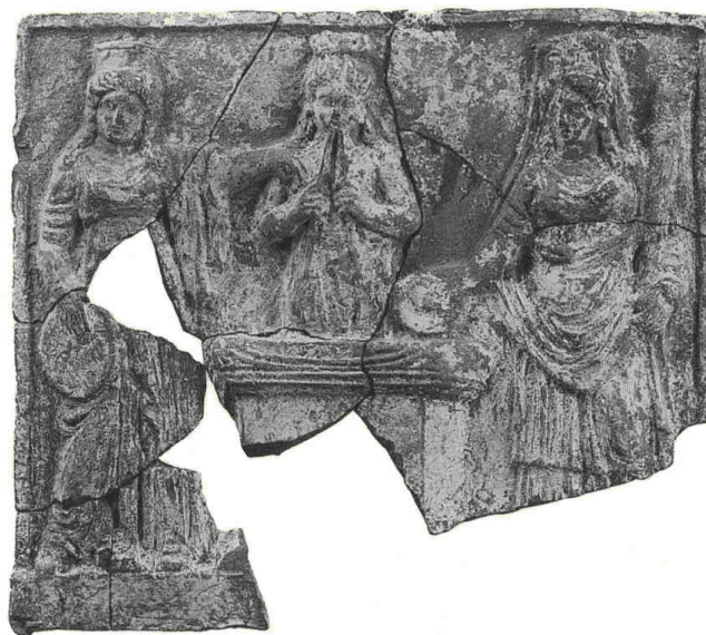
Fig. 7: Pinax con suonatrice di aulos dietro un altare, figure femminili con tympanon e con fiaccola e phiale , Lipari, Museo Archeologico Regionale Eoliano, inv. 18198 (Sardella – Vanaria 2000, tav. I 1)

Al centro della scena dietro l'altare è raffigurata una suonatrice di aulos che ha le guance gonfie perché impegnata ad insufflare nelle due canne dello strumento. Il suo copricapo si distingue da quello delle altre figure che indossano il polos , simbolo di uno