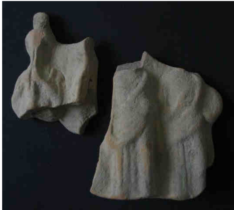
Fig. 6: Triade di figure femminili con l' aulos , un oggetto rotondo e il tympanon . Aidone, Museo Archeologico, S.n.i. (Raffiotta 2007, fig. 29)