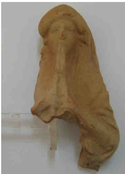
Fig. 1: Statuetta di suonatrice di aulos . Gela, Museo Archeologico Regionale, Inv. 20966 (Bellia 2009, nr. 57)

Le Tesmoforie erano la festa greca più diffusa e forma principale del culto di Demetra. Durante il loro svolgimento le donne rendevano omaggio alla dea, celebrando la festa tra loro e portando come offerta i porcellini per il sacrificio. Questa azione rituale troverebbe spiegazione nel mito legato al ratto di Core e all'angosciosa ricerca della figlia da parte di Demetra che istituì le Tesmoforie dopo che Core era sprofondata nella terra, trascinando con sé i maiali del pastore Eubuleo 19 .