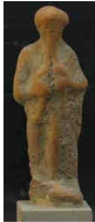
Fig. 4: Statuetta di suonatrice di aulos . Palermo, Museo Archeologico Regionale (Gasparri in corso di stampa).