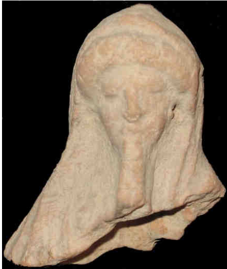
Fig. 2: Frammento di suonatrice di aulos . Agrigento, Museo Archeologico Regionale, C. 450 (Bellia 2009, nr. 24).